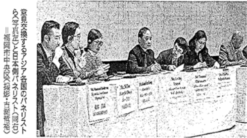
福岡大学経済学部のシニア会員のバネリスト