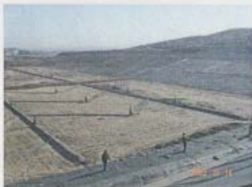
潍坊市新建造的垃圾填埋场